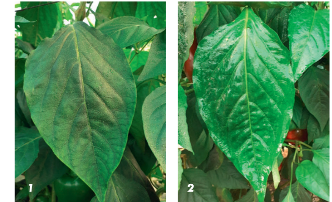
1 - Pulverización con agua en cultivo de pimiento